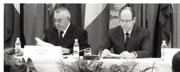
Da sinistra il presidente dell'Apm Abdelwahed Radi e il principe Alberto II di Monaco

I lavori della Terza Sessione plenaria dell'Assemblea Parlamentare del Mediterraneo, svoltasi a Montecarlo, sono stati aperti dal presidente Abdelwahed Radi che ha ripercorso, nel suo intervento, tutti i passaggi fondamentali e l'evoluzione dell'Apm dal 1992 ad oggi. All'incontro è intervenuto il principe Alberto II di Monaco che nel suo discorso di benvenuto ha ricordato come il suo Principato si sia battuto per il rispetto dell'ambiente nel bacino del Mediterraneo, soprattutto in accordo con numerose organizzazioni internazionali. Il sovrano monegasco ha sottolineato l'importanza del suo paese specialmente dopo l'adesione, lo scorso 13 luglio 2008, all'Unione per il Mediterraneo. "La neutralità e l'apprezzamento del principato di Monaco - ha sottolineato - lo rendono l'interlocutore privilegiato per promuovere il dialogo tra le diverse istanze istituzionali e della società civile".