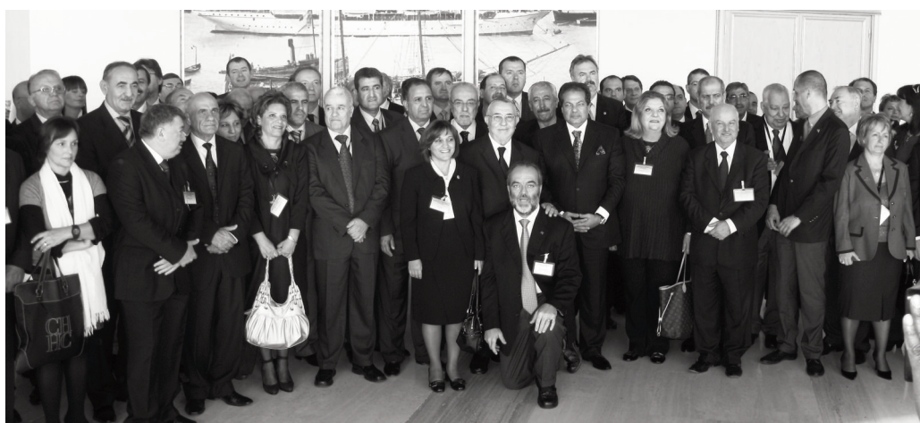
La foto di famiglia dei parlamentari intervenuti alla sessione plenaria

Il riconoscimento a conclusione dell'Assemblea Parlamentare del Mediterraneo