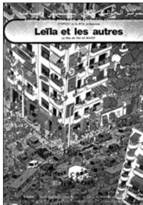
Leïla et les autres

Istituzione a carattere pubblico (che gode quindi di sovvenzioni statali), la Cineteca Algerina, fondata nel 1964, opera oggi a pieno regime. In origine consisteva semplicemente in una sala di proiezione, rue Larbi Ben M'hidi ad Algeri e svolgeva soprattutto il ruolo di cineclub e non di cineteca nel senso classico del termine. Oggi invece, risponde a tutti i requisiti fissati dalla FIAF (Fédération Internationale des Archives du Film) che contraddistinguono un'autentica cineteca: il recupero, la raccolta, la conservazione e la protezione di film. 10.000 lungometraggi e 5.000 cortometraggi costituiscono i suoi archivi filmici; mentre le raccolte di foto e manifesti insieme al centro di documentazione - biblioteca arricchiscono e completano questo tesoro. Giornalisti, studenti e ricercatori possono trovarvi tutti gli elementi che permettono loro di procedere nel lavoro. Un'altra attività fondamentale della cineteca Algerina, la diffusione, ha recentemente conosciuto una grande crescita. Vediamo quindi che dieci sale cinematografiche disseminate in tutto il paese (Orano, Sidi-Bel-Abbés, Sidone, Béchar, Tiaret, Blida, Béjaïa, Constantina, Batna e Annaba) si aprono a un fedele pubblico di cinefili. Queste sale con programmazioni giornaliere sono affiancate da una biblioteca. Infatti la letteratura rappresenta un legame indispen-