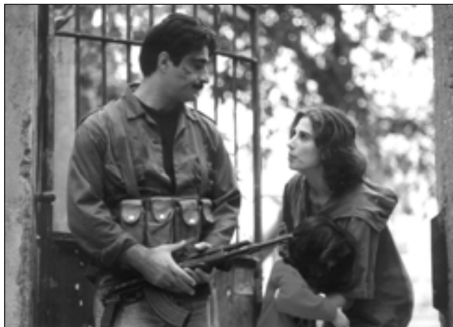
L'ombre de la ville

La Cineteca non ha ovviamente il diritto di sfruttare commercialmente i film in deposito, ma può proiettarli nelle sale che dipendono dal Ministero della Cultura e prestarle ad altre Cineteche o Festival.