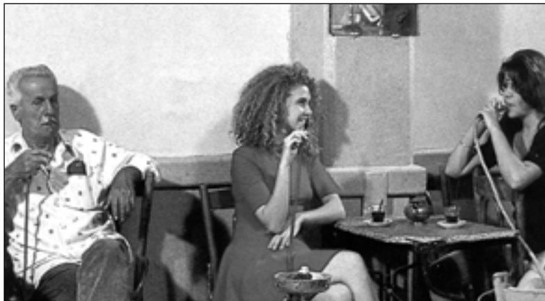
Il était une fois Beyrouth - Histoire d'une star

Sono disponibili oltre centinaia di fotografie originali (in bianco e nero o a colori) sui film e sugli attori. Esse sono in corso di archiviazione su un computer con un programma di gestione di immagini e saranno prossimamente consultabili su supporto informatico grazie alla collaborazione della Missione culturale francese.