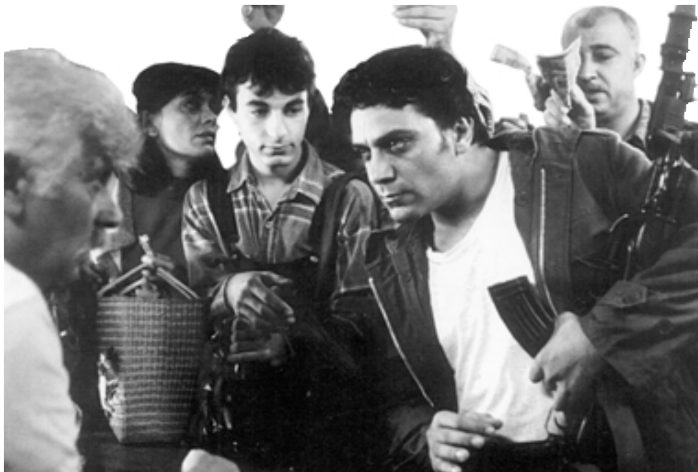
Il était une fois Beyrouth

La Cineteca Nazionale del Libano intende organizzare delle esposizioni nella sua sede, presso il Palazzo dell'UNESCO, o all'esterno, su temi scelti legati al cinema libanese, arabo e internazionale. Essa progetta anche di organizzare dibattiti e conferenze su temi legati al cinema, invitando degli specialisti libanesi e stranieri di fama.